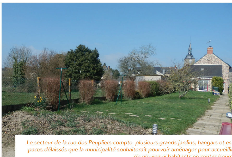
Le secteur de la rue des Peupliers compte plusieurs grands jardins, hangars et espaces délaissés que la municipalité souhaiterait pouvoir aménager pour accueillir de nouveaux habitants en centre-bourg

Ces dernières années, le développement urbain communal était prévu par l'intermédiaire d'une ZAC de 18 ha sur le secteur de Bignon au nord-ouest de la commune, démarquant juste derrière l'église. A la création de la ZAC en 2008, l'opérateur retenu pour l'aménagement fut Acanthe, avec un projet d'aménagement intégrant une mixité des formes urbaines. L'évolution du contexte économique du marché immobilier a amené Acanthe à revoir son programme en l'orientant davantage vers la production de lots libres, ce qui ne correspondait plus aux souhaits des élus. Par ailleurs, lors de la réalisation des études préliminaires pour le dossier de ZAC, un enjeu zone humide est apparu dans le secteur d'étude. Après réalisation d'une étude additionnelle pour identifier et délimiter précisément les zones pouvant être réellement aménagées, la commune a décidé de ne pas poursuivre la démarche de ZAC. Elle émet le souhait de réorienter sa stratégie urbaine vers le renouvellement et la densification du centre-ville ainsi que vers l'amé-