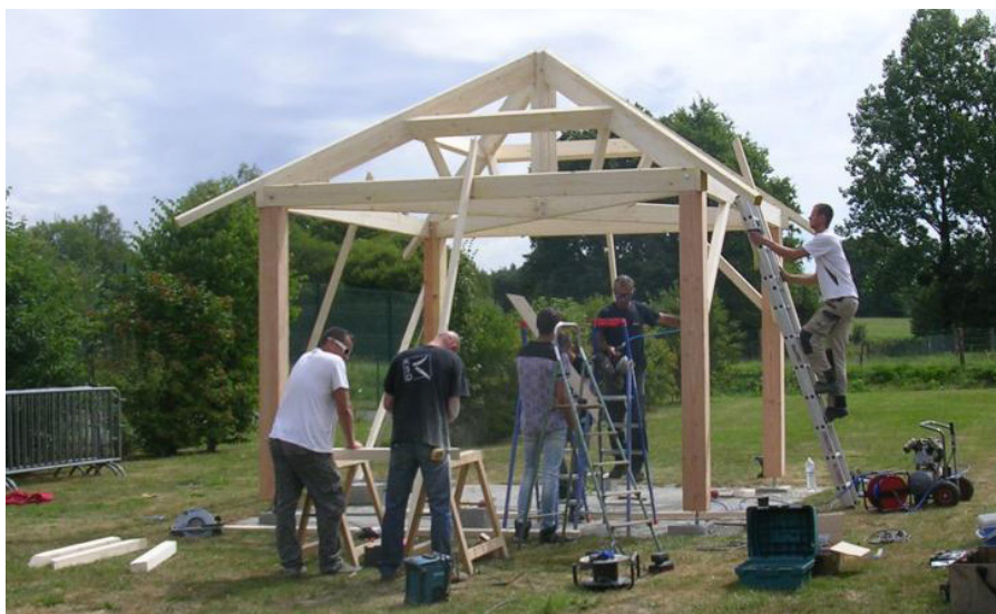
Encadrés par deux adultes artisans de métier, les jeunes ont construit le kiosque en 3 jours

Les deux élus proposent alors aux jeunes d'écrire un courrier à la mairie pour exprimer leurs demandes et leurs motivations. Accompagnés par l'animateur du centre de loisirs, ils adressent une lettre signée de la jeunesse dolaysienne à la commune. Fin mai 2014, quatre jeunes sont