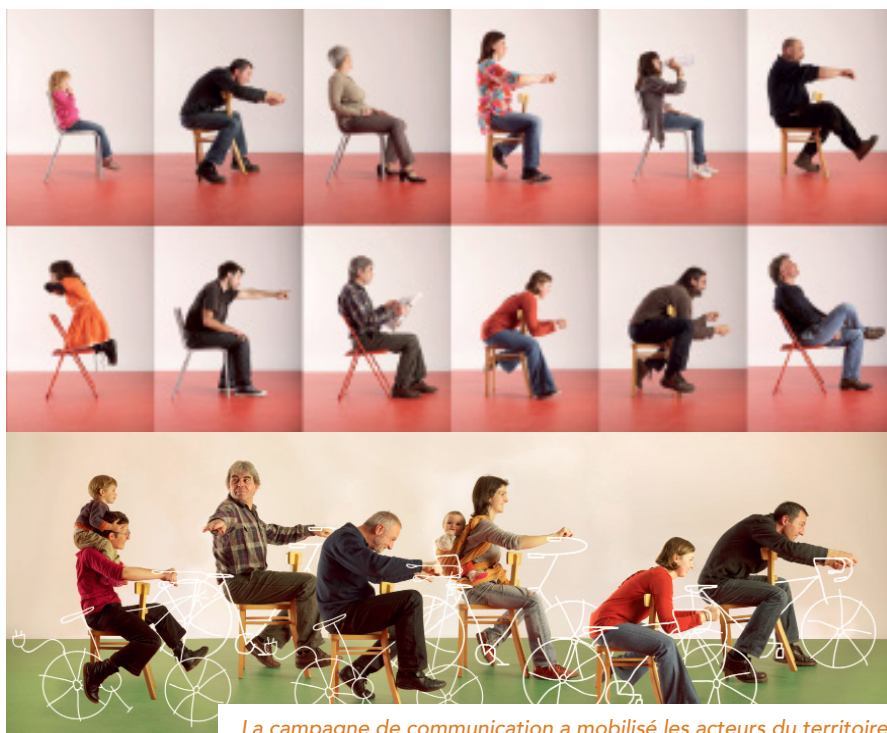
La campagne de communication a mobilisé les acteurs du territoire

Les élus insistent sur l'importance d'une approche non culpabilisante et conviviale, afin de mettre en avant les aspects positifs des alternatives, comme réelles solutions aux enjeux qui sont les nôtres. ■