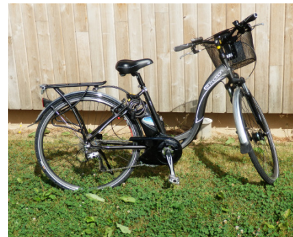
Le vélo électrique retenu par la CCVI, d'une autonomie de 80 à 100 km.