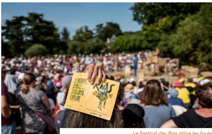
Le Festival des Rias attire les foules