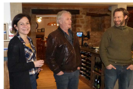
Les gérants ont investi les lieux avec goût !

Le bâtiment est en bon état et fonctionnel pour accueillir un nouveau commerce. Le jeune couple saisit donc cette occasion d'y installer une nouvelle épicerie/bar et signe un bail avec la mairie. Ils paient un loyer mensuel de 200 €, hors charges (électricité, eau, téléphone...) et choisit d'y effectuer des travaux d'aménagement, à ses frais (25 K€). Il refait tout l'aménagement intérieur en privilégiant des matériaux chauds et accueillants : bois (parquet, étagères, mobilier), pierres apparentes... Il ne touche pas à la partie bar aménagée de manière correcte qui reste telle quelle mais retravaille les locaux de stockage. À l'extérieur, il rajoute une simple plaque avec le nouveau nom. Le logement de l'étage est très sommaire mais reste en l'état. « La Belle Époque » ouvre ses portes le 1 er février 2019.