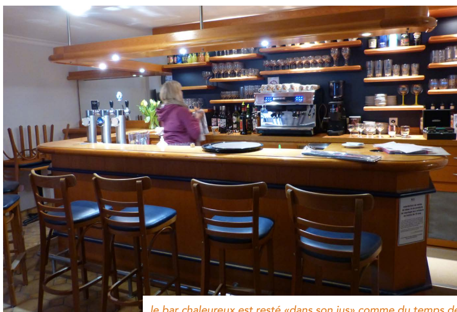
le bar chaleureux est resté « dans son jus » comme du temps de « Chez Véro »

Neuf mois après son ouverture, ce commerce a considérablement redynamisé la vie locale. La sympathie des commerçants, ce concept « zéro déchets », le bio et le local, la production du maraîcher lui-même, proposés sans esprit clivant, entraînent une fréquentation diverse et le bar apporte une dimension conviviale (concerts et bœuf musicaux) très appréciée. ■