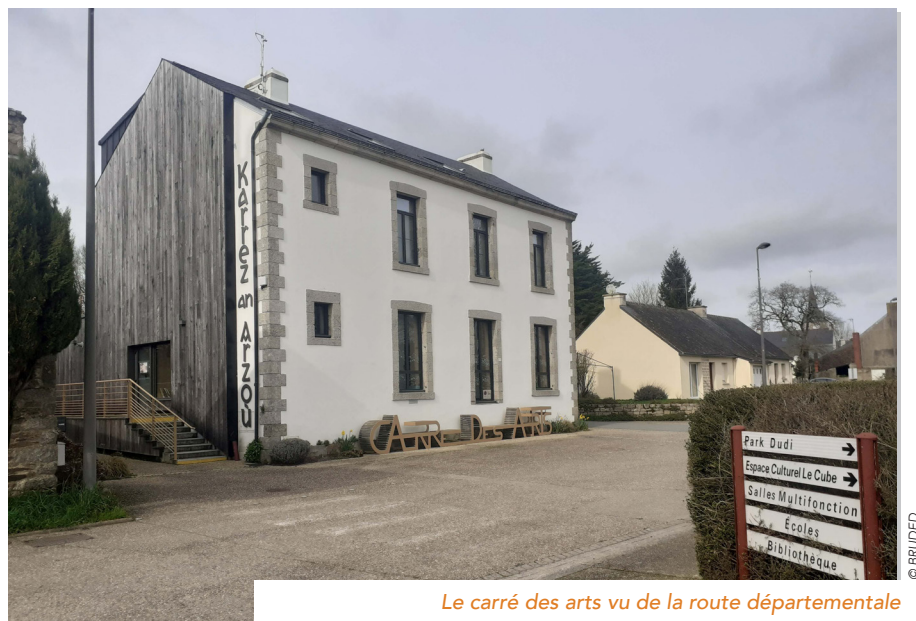
Le carré des arts vu de la route départementale

De plus, pour alimenter leur réflexion, les élus visitent avec BRUDED et le CAUE 56 des médiathèques tiers-lieux récentes à Guisriff, Saint Aubin du Pavail, Séné... Sur cette base, les objectifs du nouvel équipement se structurent : un lieu multi-usage, support d'anima-