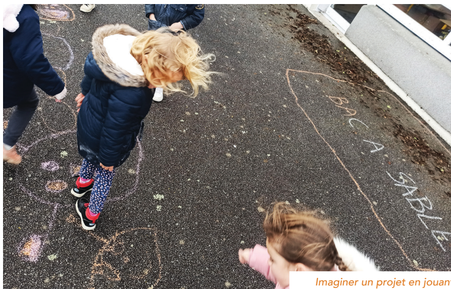
Imaginer un projet en jouant

Une demande de subvention auprès du ministère de l'éducation nationale a été déposée. ■