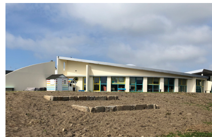
Gradins et futurs espaces verts près de la garderie seront achevés en fin d'été.

Organisés par Onésime, les temps de chantiers sont réalisés majoritairement en régie et se déroulent les mercredis et pendant les vacances. « Une des conditions de la démarche Chifoumi était de mener des chantiers sur-mesure, en évitant au maximum les éléments sur catalogue, standardisés ». Les mauvaises conditions météorologiques et la difficulté de travailler en site occupé ont engendré du retard : ils